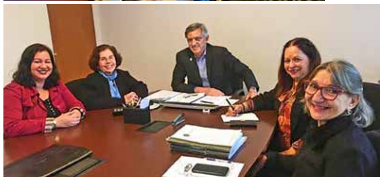
No começo da pandemia, o SESCON-RJ firmou um acordo coletivo emergencial com Seescerj, Sindeap-RJ e Sindicont-Rio